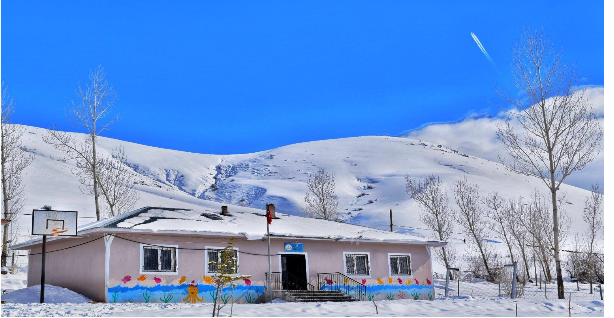
KÖYCÜK SABRİ TUNÇ İLKOKULU